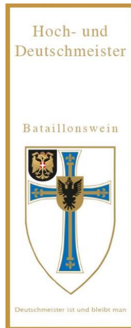
Variante 1 weiß / rot